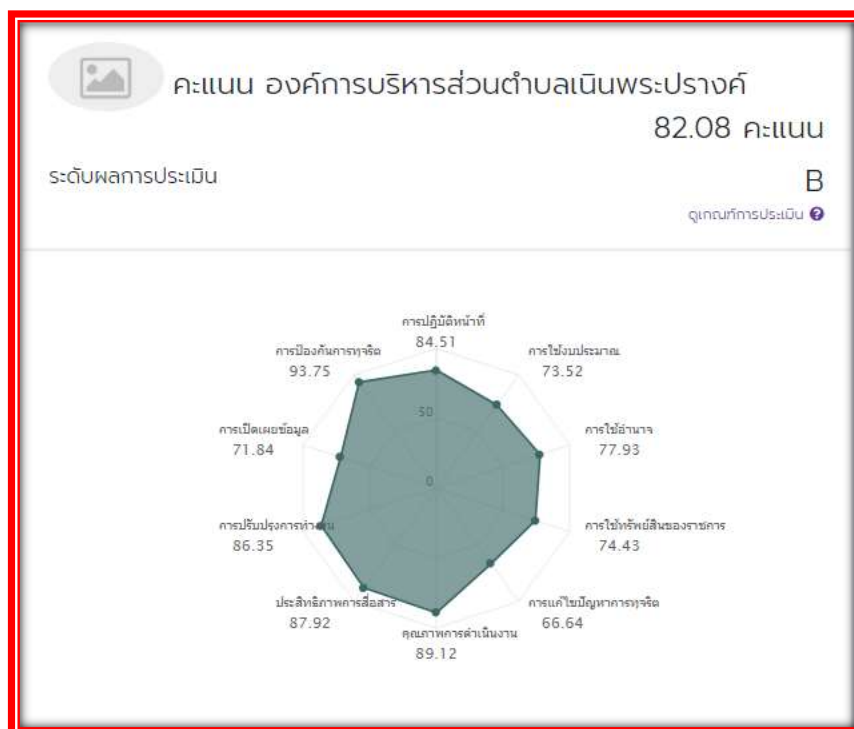
รูปภาพที่ ๑

จากผลการประเมิน ITA ในปีงบประมาณ พ.ศ. ๒๕๖๕ ขององค์การบริหารส่วนตำบลเนินพระปรางค์ มีผลคะแนน ๘๒.๐๘ คะแนน ระดับผลการประเมิน อยู่ในระดับ B